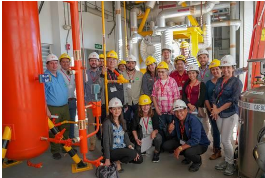
Technology Roadshow in Costa Rica 2019