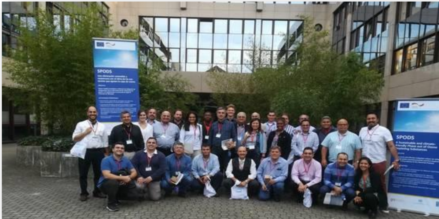
Study Tour in Germany 2018